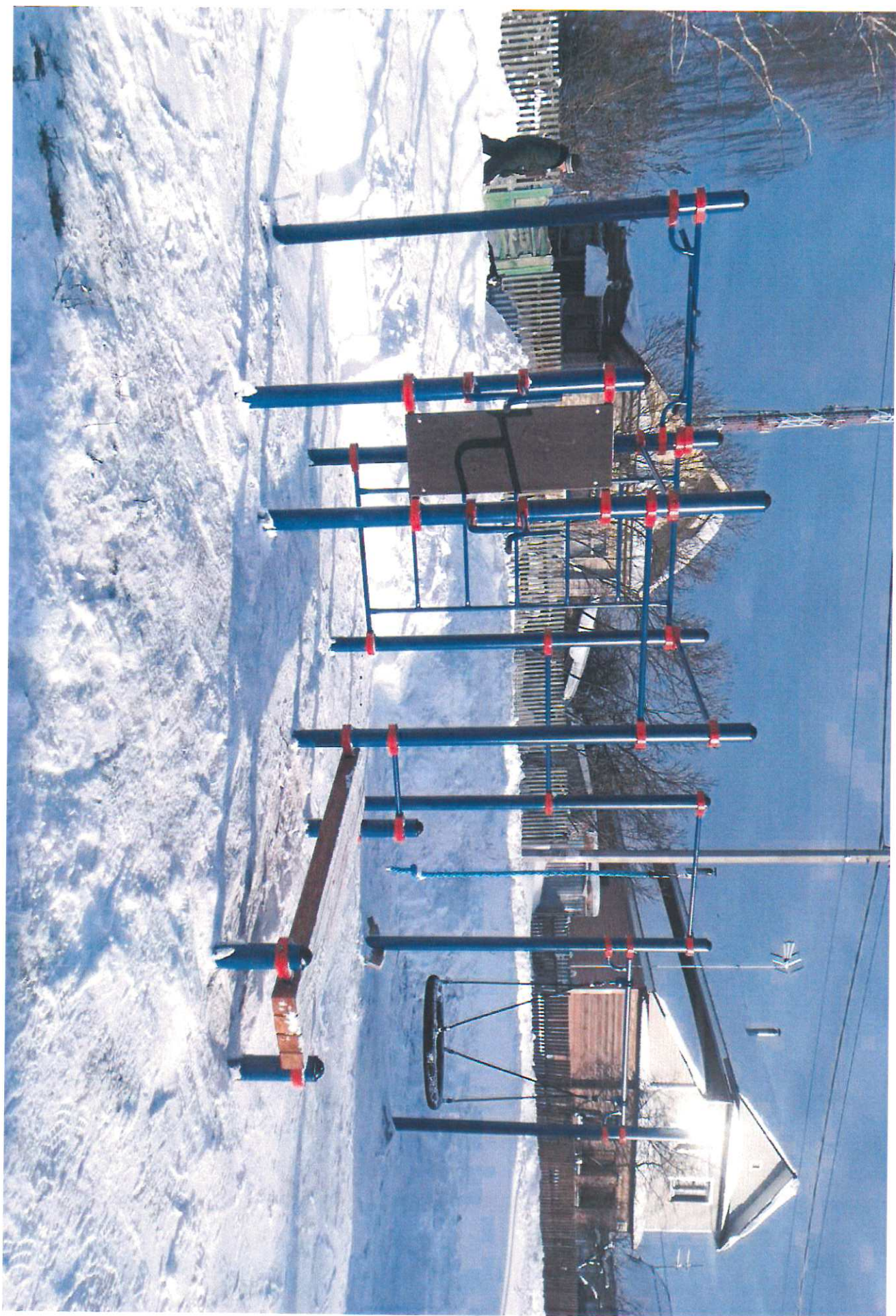
Фотографии объекта по итогам реализации проекта