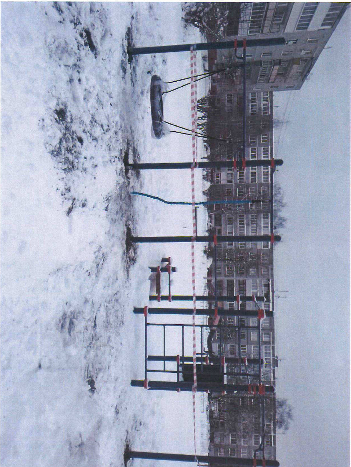
Фотографии объекта по итогам реализации проекта