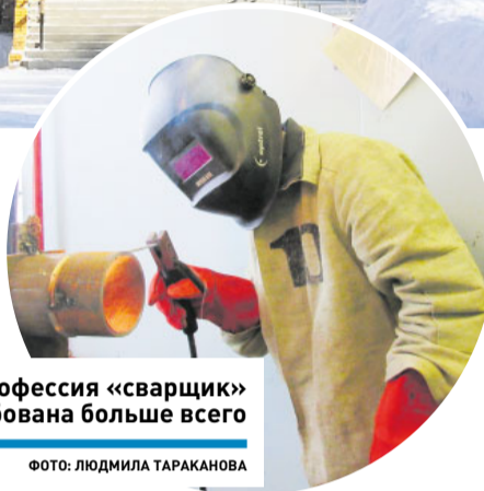
Профессия «сварщик» востребована больше всего