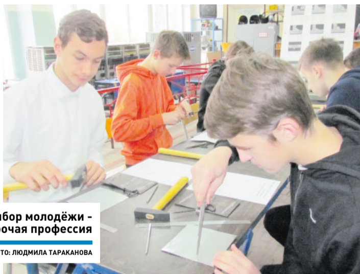
Выбор молодежи – рабочая профессия

ОБРАЗОВАНИЕ ] В Воскресенском колледже готовят специалистов по новой программе