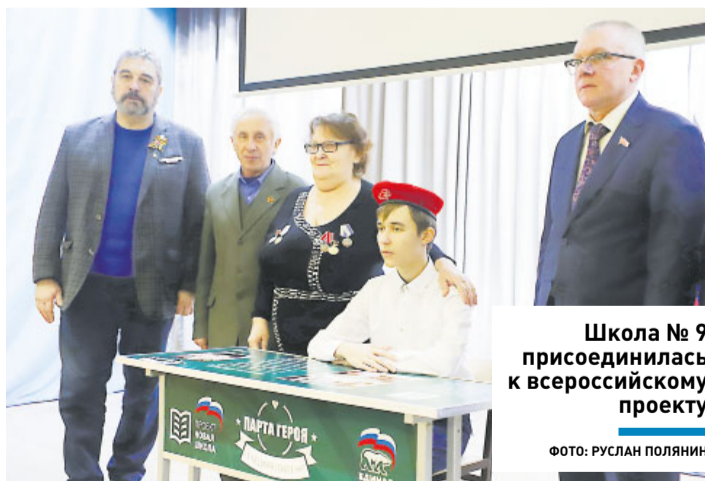
Школа № 9 присоединилась к всероссийскому проекту