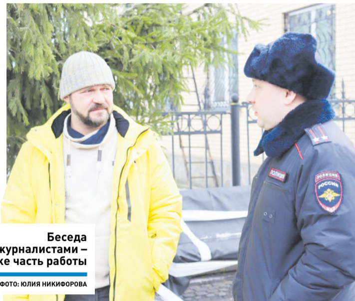
Беседа с журналистами – тоже часть работы