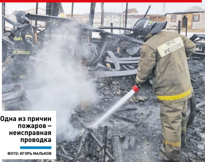
Одна из причин пожаров – неисправная проводка

ПРОИСШЕСТВИЯ | В округе приняли более 3000 вызовов за неделю